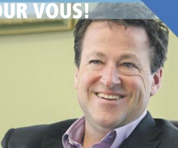
DONALD MARTEL Député de Nicolet-Bécancour