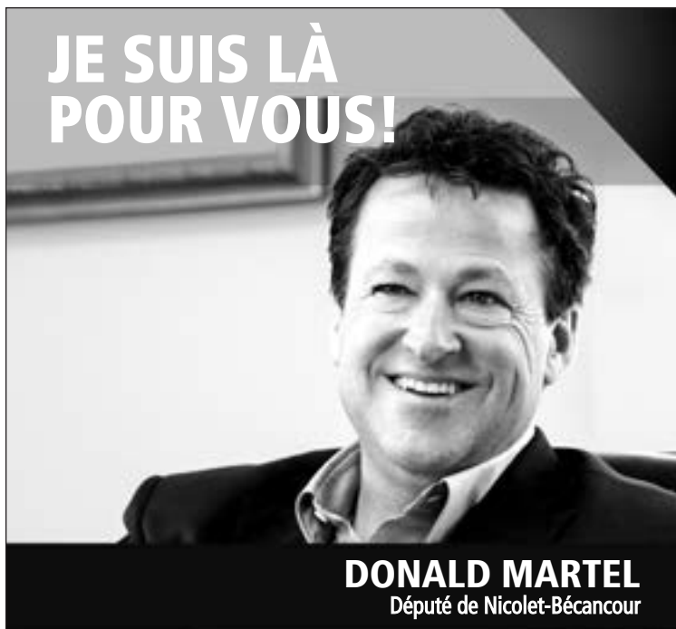
DONALD MARTEL Député de Nicolet-Bécancour