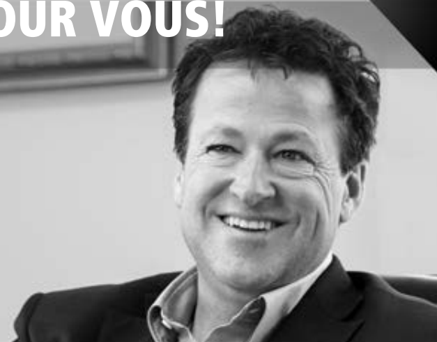
DONALD MARTEL Député de Nicolet-Bécancour