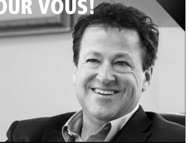
DONALD MARTEL Député de Nicolet-Bécancour