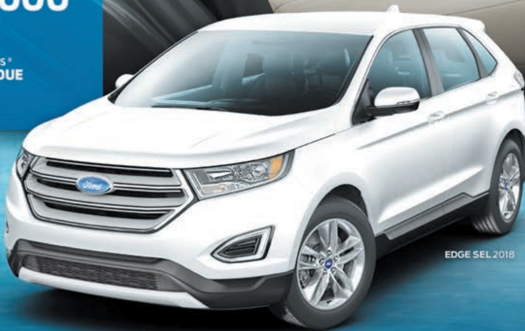
EDGE SEL 2018