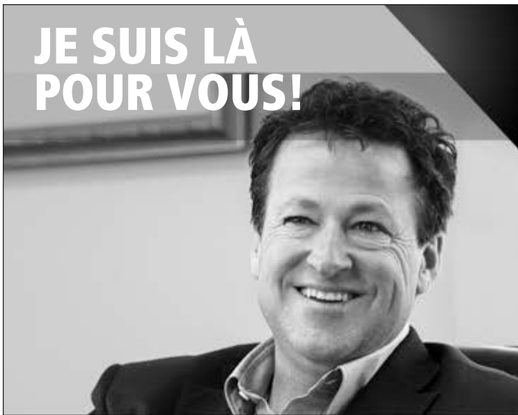
DONALD MARTEL Député de Nicolet-Bécancour