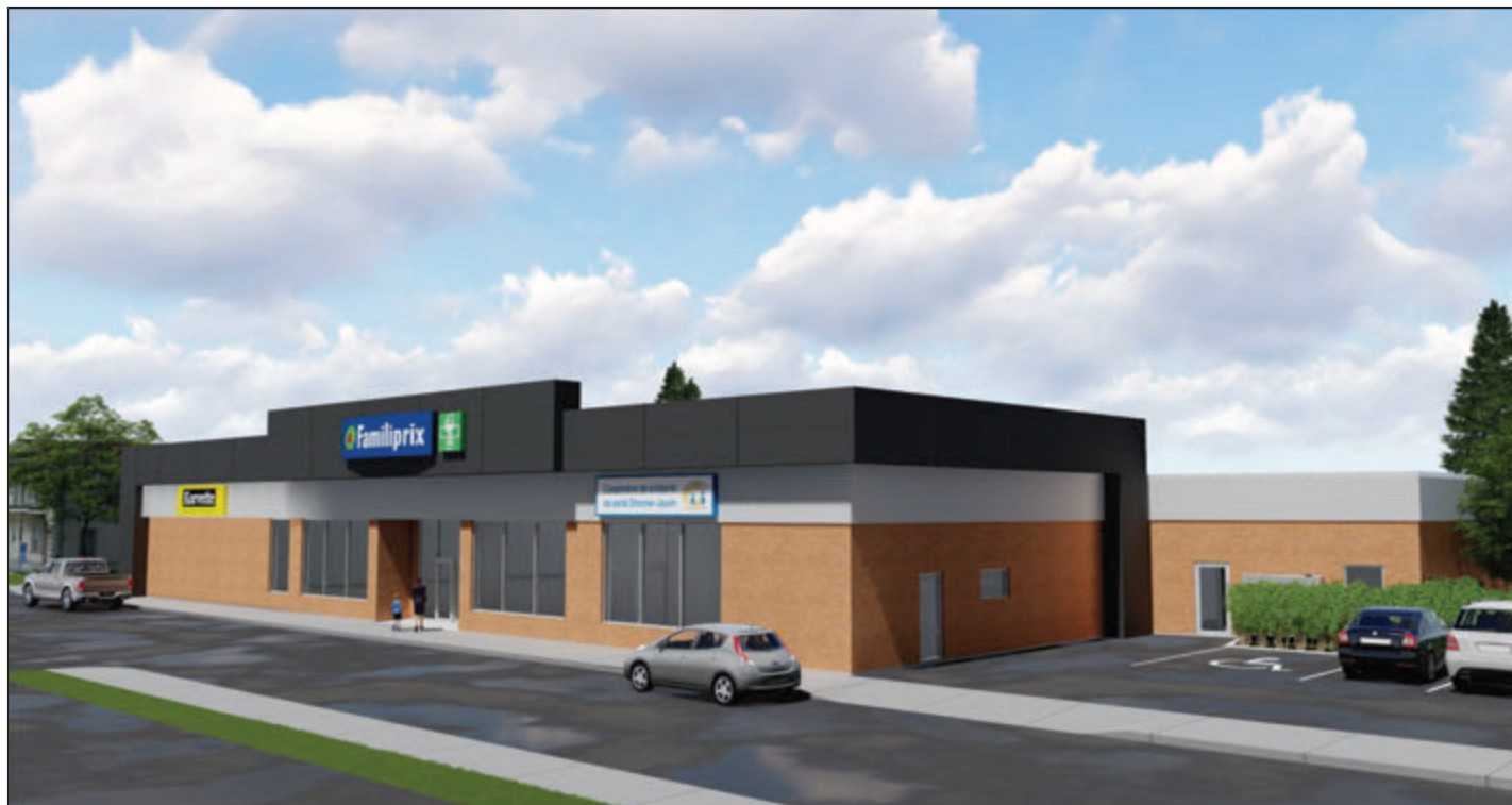
Perspective préliminaire l'immeuble qui abrite la Coopérative de solidarité santé Shooner-Jauvin, présentée dans le cadre d'une étude menée conjointement par la Municipalité de Pierreville et Dr Karl Shooner.

INFOGRAPHIE PAR ÉRIC CHAMPAGNE ARCHITECTE