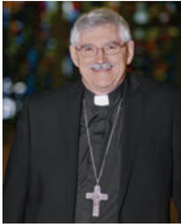
PAR MGR ANDRÉ GAZAILLE ÉVÊQUE DE NICOLET

Pour moi, cette période représente avant tout la célébration de l'avènement de Jésus qui naît parmi nous comme un frère. Une naissance qu'on célèbre la nuit de Noël, alors que c'est cet enfant nouveau-né qui nous montrera le chemin pour trouver la lumière, même au milieu des ténèbres.