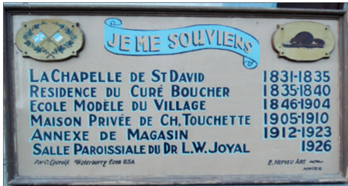
Ci-dessus, le tableau rappelle l'histoire de l'immeuble ayant été construit pour servir de chapelle, mais qui a eu bien d'autres fonctions.

Le 17 octobre 1999, Mme Prudentienne Langlais, elle-même native de Saint-David, envoie à M. le curé Jean-Marie Brouillette, une photo de l'immeuble dont il est question dans le tableau. La petite photo (4cm x 9cm) datée du 7 août 1937 est la seule photo