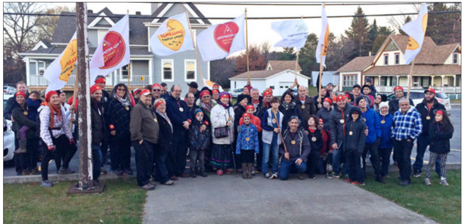
La compétition amicale a attiré 103 participants ont cumulé 159 heures de marche.

Rappelons qu'en septembre 2010, le Dr Volland entreprenait la marche Innu Meshkenu. Son ambition est de promouvoir l'adoption de saines habitudes de