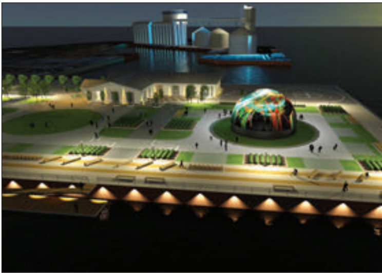
Un dôme translucide de 20 mètres de diamètre proposera un spectacle immersif sur 360 degrés relatant la fabuleuse histoire de Sorel-Tracy.

UN CARREFOUR INCONTOURNABLE DU FLEUVE ST-LAURENT ET DE LA RÉSERVE DE LA BIOSPHERE DU LAC-SAINT-PIERRE