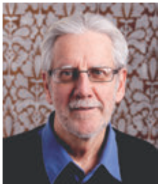
PAR JACQUES CRÉPEAU SOCIÉTÉ D'HISTOIRE DE SAINT-DAVID D'YAMASKA

ON NE SAIT PAS QUAND LA CHAPELLE DE SAINT-DAVID EST DISPARUE, MAIS UNE NOTE AU BAS D'UNE PHOTO D'ARCHIVES NOUS APPREND QU'ELLE ÉTAIT ENCORE LÀ EN 1937