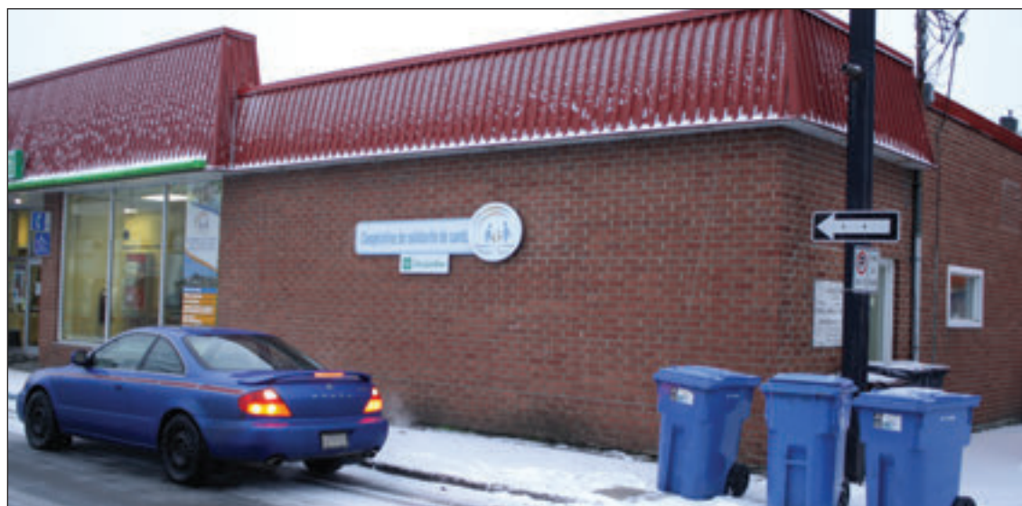
Les locaux actuels de la Coop de santé, situés sur la rue Georges à Pierreville.