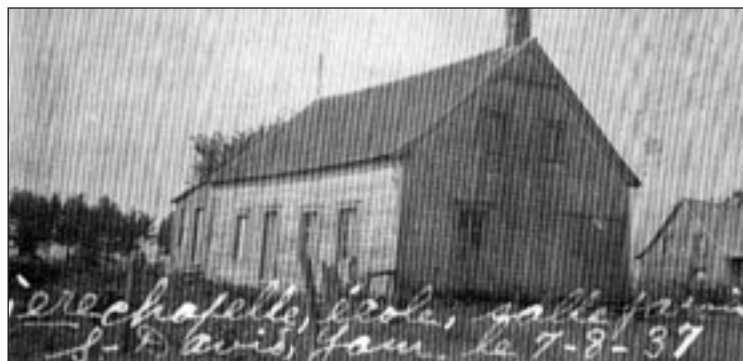
La seule photo connue de la chapelle remonte à 1937.

Le tableau et la photo nous aident à retracer l'histoire de la chapelle de Saint-David. L'immeuble qu'on voit sur la photo, mesure 10,7 mètres (35 pieds) de largeur sur la route Saint-Nicolas ou rang des Rameaux, aujourd'hui rue Principale, et il a une profondeur de 24,4 mètres (80 pieds) sur la rue dite de la Chapelle menant à la rue Sainte-Henriette. (Ces rues existent encore sur papier mais elles ne sont